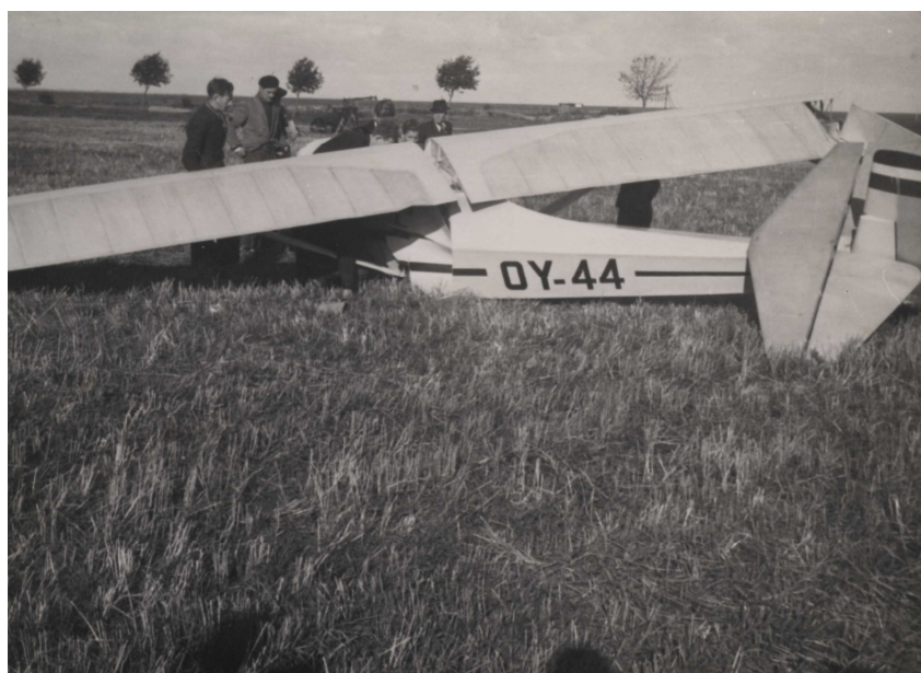
OY-44 er prøvefløjet af køber!