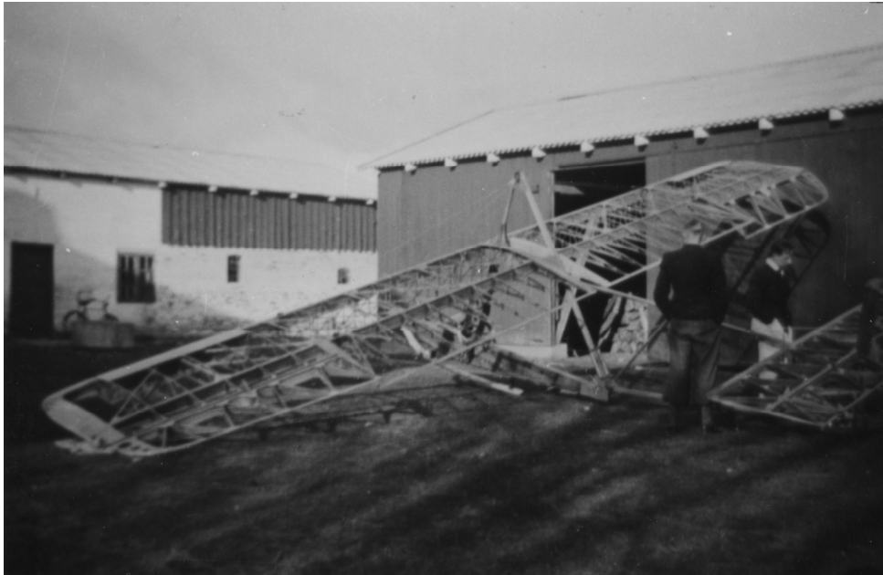
OY-60 prøveopspændt på gårdspladsen, værkstedet ses i baggrunden.