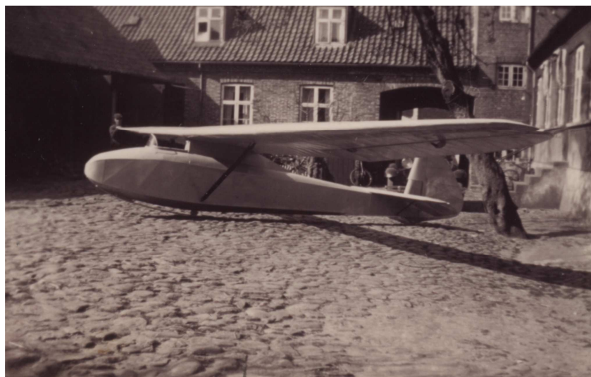
OY-83 færdigbygget på Bornholm