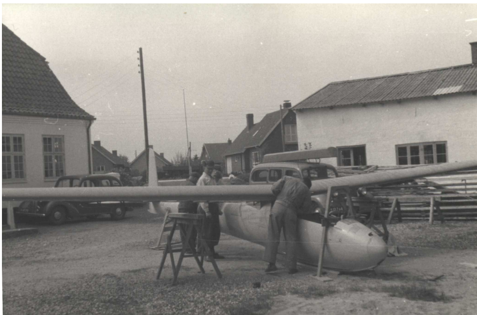
OY-VOX prøveopspændt for kontolmåling i forbindelse med genopbygningen. I baggrunden "biografmandens" gamle ambulance med rejse-biografudstyret – det er filmværret på taget!