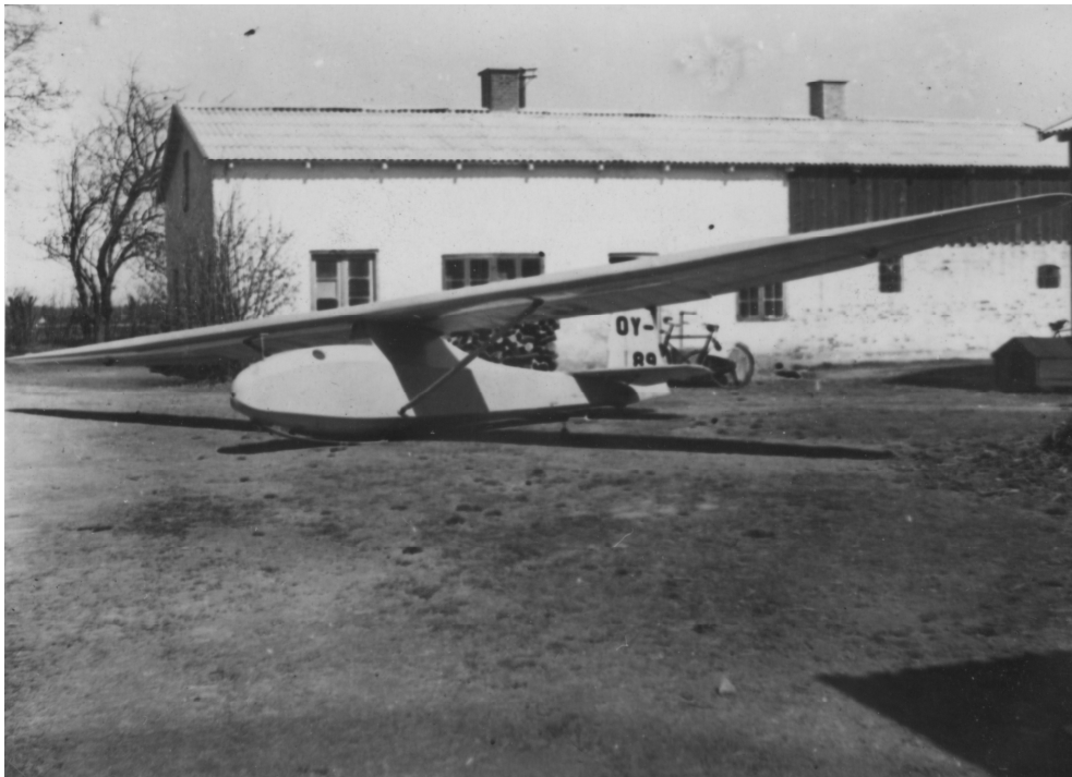
OY-89 opspændt foran værkstedet efter at være blevet færdigbygget.