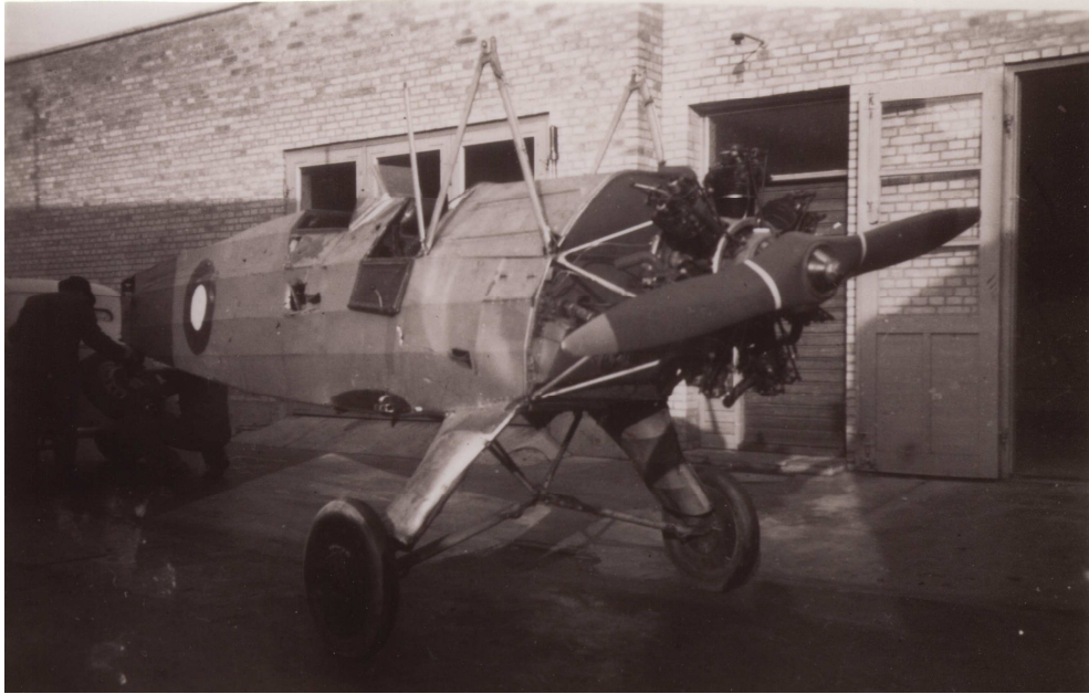
FW44 spændes bagefter autoforhandlerens bil for transport fra Avnø til Køge.