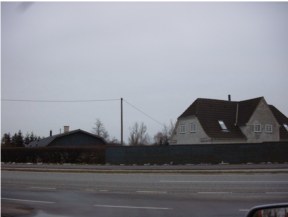
Gården i Hastrup marts 2005. Værkstedet er bygningen til venstre.